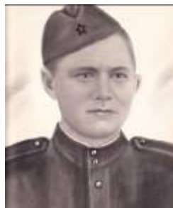
битва, длившаяся до июля 1944 года.